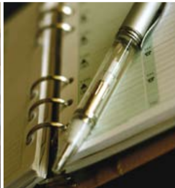
Ønsker du at livet ditt skal ta en spesiell retning, må det manifesteres i omgivelsene dine.

Vi vet at mange raskt blar om til neste side med en gang man begynner å introdusere merkelige kinesiske begreper og ord som "tao", "qi", "yin" og "yang". Derfor skal vi prøve å unngå det her. Hvis du virkelig vil gå i dybden og lære hvordan du kan benytte deg av prinsippene i feng shui, trenger du mer enn en kort artikkel. Det beste er da å kontakte en seriøs feng shui-konsulent. Men vi skal forsøke å kanskje åpne noen dører for deg som tror at feng shui bare er tull.