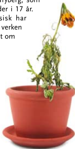
Vissen blomst? Ditt liv signal

For mer informasjon, se f.eks. Birgitta Trybergs bøker "Se ditt liv med nya ögon – feng shui som livsguide" (Energica, Sverige, 2005) eller hennes web-side www.goodliving.se .